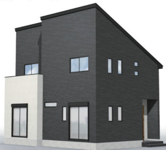
建物完成イメージパース